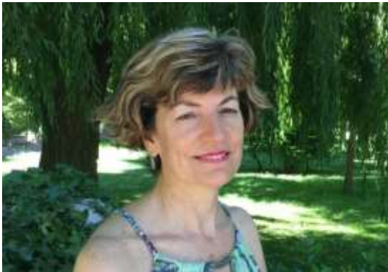
Autor: Miguel Ángel Casado Hernández

Valladolid, España, 1967. Es poeta y profesora titular de Literatura Hispanoamericana de la Universidad de Salamanca, donde coordina la Cátedra Chile. Antologías de su poesía han sido publicadas en Caracas, Ciudad de México, Quito, Nueva York, Monterrey, Bogotá y Lima. Obra suya ha sido editada bilingüe en Italia, Portugal, Brasil y Estados Unidos. Su libro Incendio mineral acaba de ganar el Premio Nacional de la Crítica.