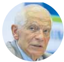
Josep Borrell Alto representante de la UE para asuntos exteriores

«Europa se ha construido sobre la base del mercado. Ahora se construirá sobre la seguridad»