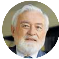
Dario Villanueva Crítico literario y exdirector de la RAE

«La ciencia del cuidado es el pivote del trabajo de la enfermería y debe tener un lugar preeminente en los sistemas de salud»