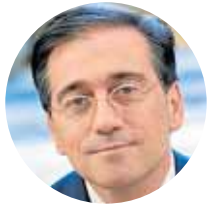
José Manuel Albares Ministro de Asuntos Exteriores

El ministro de Asuntos Exteriores, Cooperación y Unión Europea se encarga de inaugurar el curso dedicado a 'España en el Mundo II. Política exterior española'.