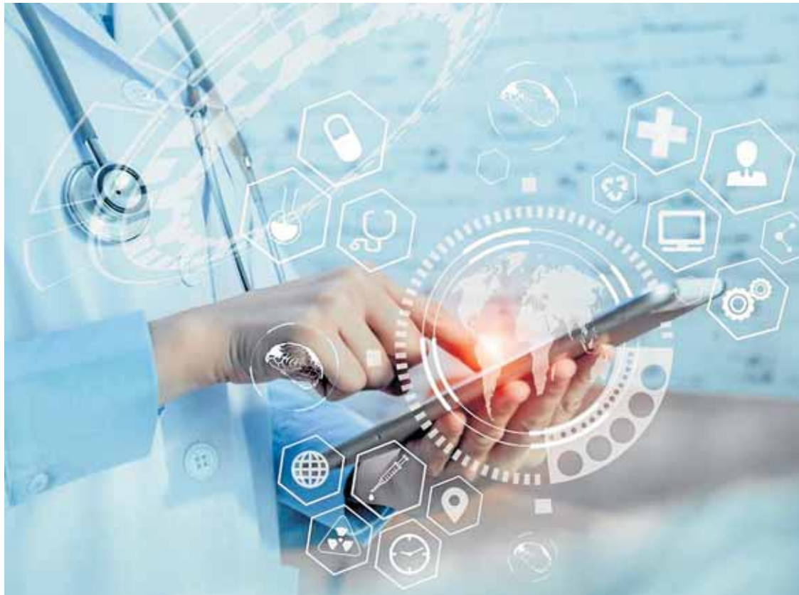
El sector de la sanidad está viviendo una auténtica revolución de la mano de las tecnologías de la información y las comunicaciones. Un foro aborda este campo de presente y futuro. UE

Asimismo, la UIMP acoge durante estos días el encuentro 'A cuatro manos. Teoría general del Derecho', dirigido a estudiantes de esta disciplina, así como a profesionales que quieren profundizar en teoría y práctica de este ámbito de estudio. Además, la cuestión médica también tiene reflejo académico en la UIMP gracias a dos encuentros que se celebrarán a final de la semana. Se